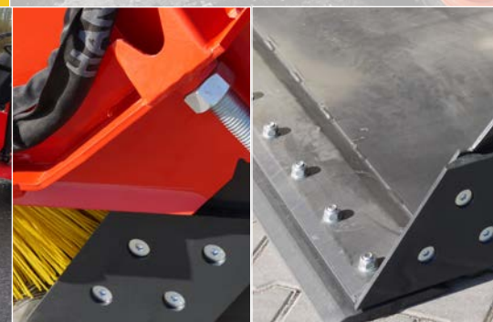
Wechselbare Verschleißmesser unten und seitlich