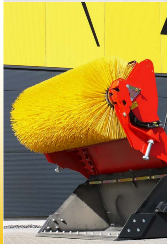
Hydraulische Aufklappung (optional)