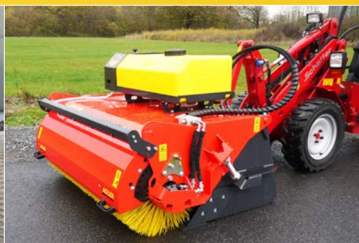
KS 600 im Radladeranbau mit Wassersprüheinrichtung