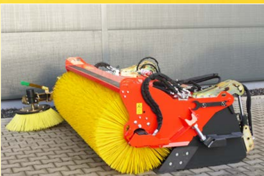
Kehrschaufel optional mit Seitenbesen erhältlich