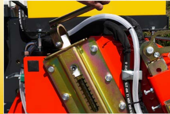
Bürste stufenlos einstellbar