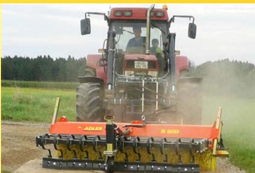
Kratzvorrichtung K 600 ohne Schmutzsammelbehälter