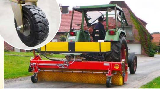
Geeignet für den Traktor im Heck- und Frontanbau