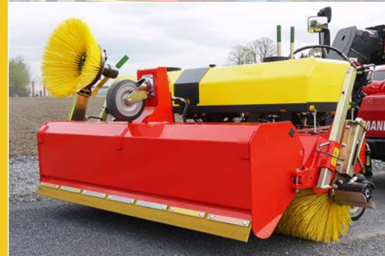
Freikehrmodus, hydraulische Behälterentleerung und drittes Stützrad am Sammelbehälter