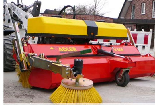
Seitenkehrbesen und Wassersprüheinrichtung als Option