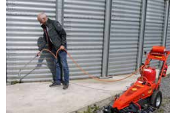
Handbrander voor moeilijk bereikbare plekken