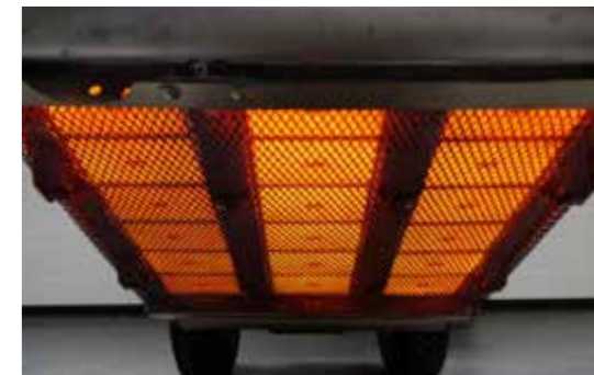
Infrarood stralen zonder open vlam!