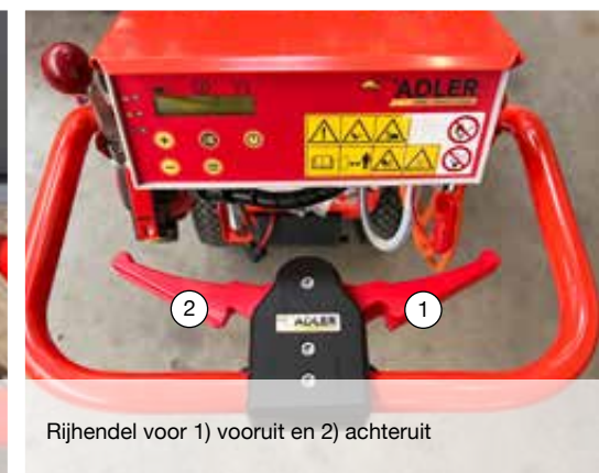
Rijhendel voor 1) vooruit en 2) achteruit