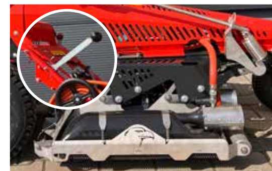
In hoogte verstelbare infrabox voor wegen en terreinen.