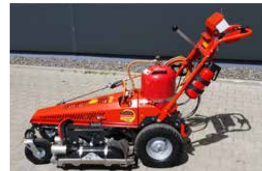
Grote wielen met differentieel aandrijving zorgen voor wendbaarheid en handig werken.