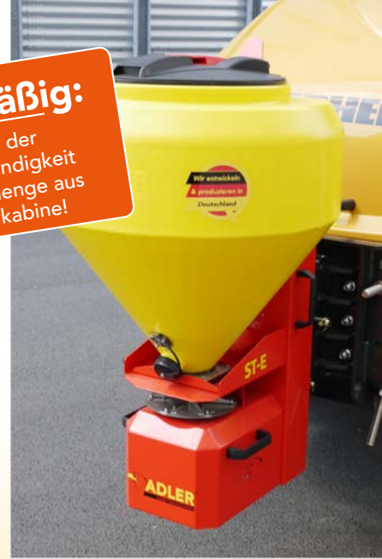
Salzstreuer im Hof-/Radladeranbau

Regelung der Drehgeschwindigkeit & Ausbringungsmenge aus der Fahrerkabine!