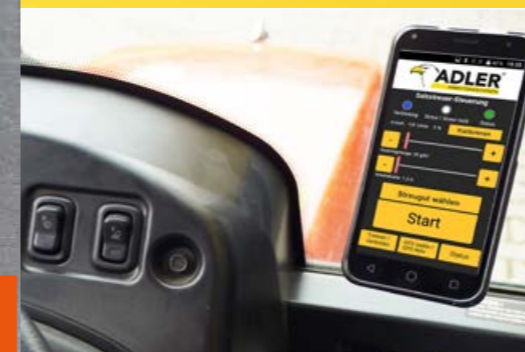
Drehgeschwindigkeit und Ausbringungsmenge werden bequem per Smartphone aus der Fahrerkabine eingestellt