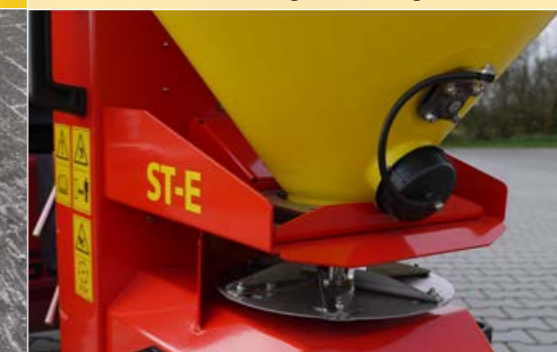
Streuweiten bis zu 6 m, regelbar über die Drehzahl