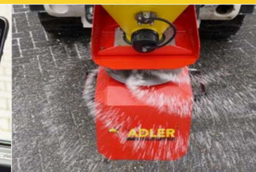
12-Volt-Getriebemotor für den Streuteller